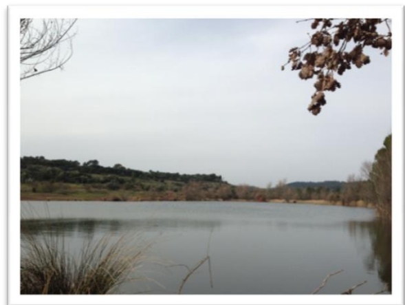
Etang de Colbert

CHRISTIANE : Nous étions 5 du GEM. Nous avons vu un petit lac : l'étang de Colbert, site protégé pour la pêche. Il y avait des hélicoptères qui tournaient toute la journée, car la base ALLAT se trouve à proximité. Nous avons fait le tour du lac, nous avons pique-niqué, pris des photos. Nous ne nous sommes pas baignés, et comme il faisait trop froid nous ne nous sommes pas attardés.