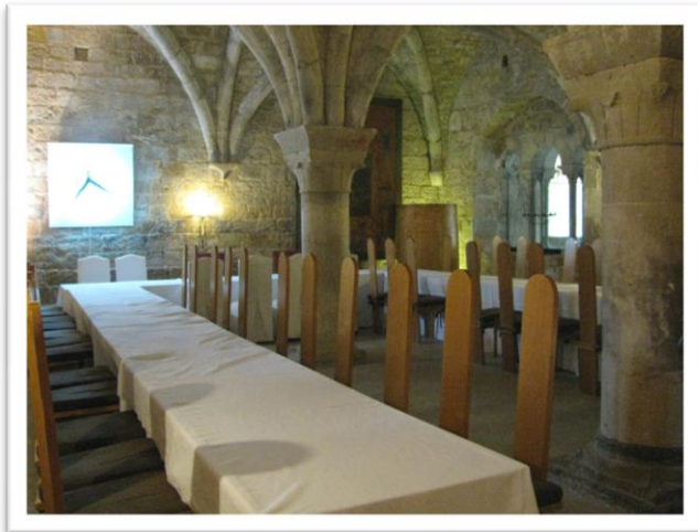
La salle du Chapitre

Cet édifice est d'une telle beauté qu'on y a adjoint de nos jours un hôtel 5 étoiles, tandis que la cuisine du célèbre chef Alain Ducasse est servie dans l'ancien réfectoire du monastère.