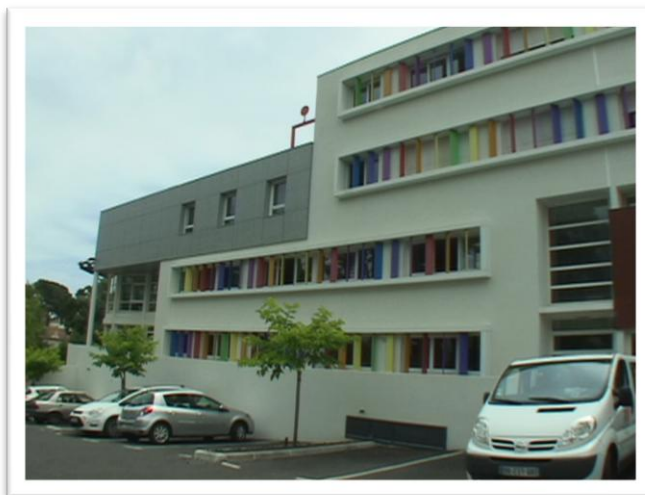
Le bâtiment principal

Le but du foyer est la réinsertion des résidents afin de les amener à l'autonomie. Ils résident d'abord dans le bâtiment principal, puis dans des studios aménagés, et enfin à l'extérieur.