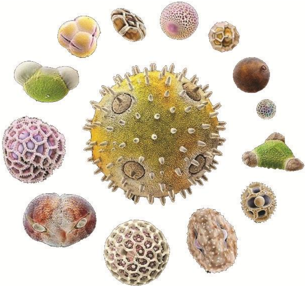
Echantillon de pollens vu au microscope